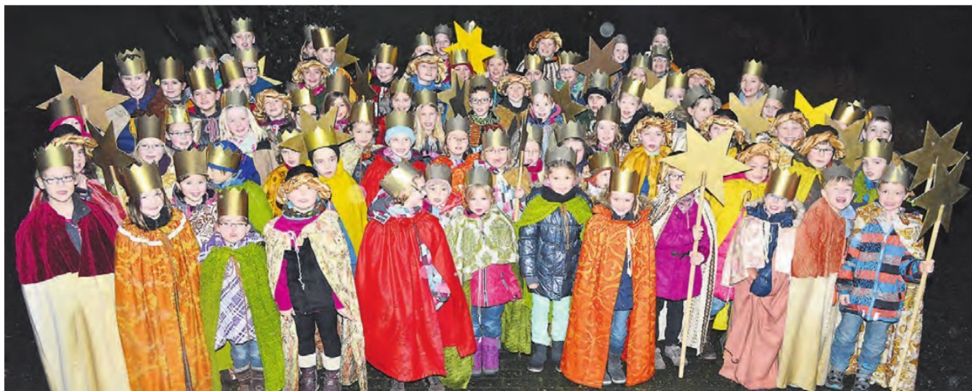
Rund 90 Sternsinger sammelten in Winnekendonk ca. 6.000 Euro für „Gesunde Ernährung für Kinder auf den Philippinen und weltweit“.

Für werdende Eltern bietet dieses Forum einen Informationsgewinn zu allen Fragen über Schwangerschaft, Entbindung, Wochenbett und Versorgung des Neugeborenen. Zusätzlich besteht die Möglichkeit zur Kreißsaalbesichtigung nach Vereinbarung. Telefonische Voranmeldung sind unter 02831/ 390-399 oder 390-398 möglich.