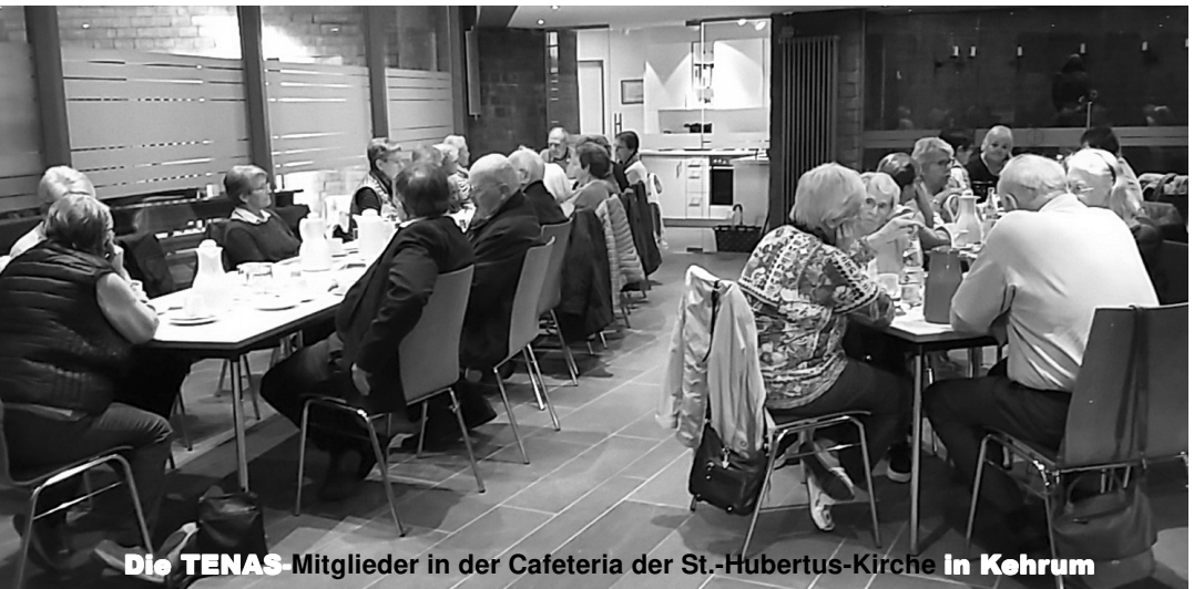
Die TENAS Mitglieder in der Cafeteria der St.-Hubertus-Kirche in Kehrum