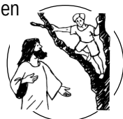
Lies: Evangelium Lukas 19,1-10