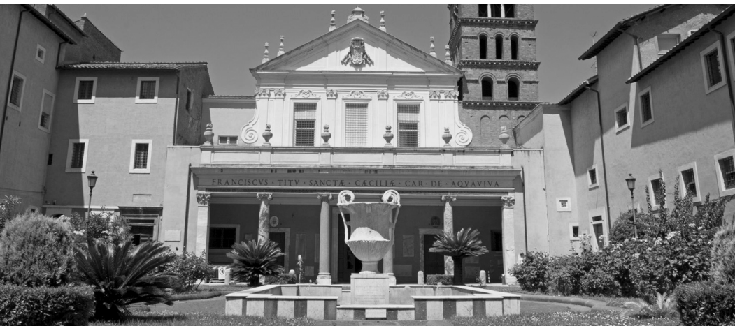
Die Kirche Santa Cecilia im römischen Stadtviertel Trastevere.