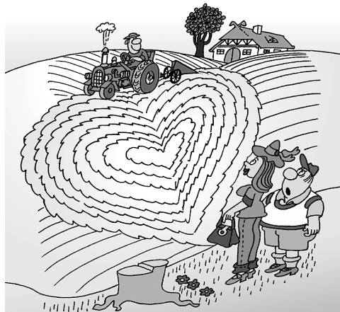
„Ich glaube, der Bauer ist in Dich verliebt!“